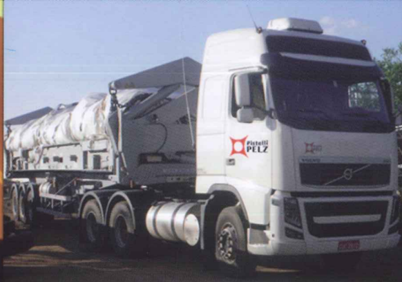
Semi-Reboque 40' descarregador lateral