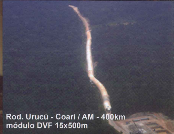
Rod. Urucú - Coari / AM - 400km módulo DVF 15x500m